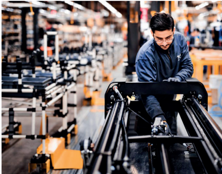
Toyota Production System

Toyota Material Handling Europe (TMHE) opera a supporto di piccole, medie e grandi imprese dislocate sul territorio europeo, per far fronte alle attuali esigenze di movimentazione e logistica delle merci. L'azienda offre una gamma completa di carrelli elevatori controbilanciati e da magazzino, oltreché servizi e soluzioni ad essi associati. TMHE ha avviato la propria attività nel 2006 con l'integrazione delle due aziende leader della movimentazione dei materiali in Europa, Toyota e BT, ed è inoltre responsabile della produzione e distribuzione di carrelli elevatori a marchio Cesab. Nell'anno fiscale 2019 (1) , TMHE ha registrato 106.000 unità vendute ed un fatturato netto totale di 2,5 miliardi di euro.