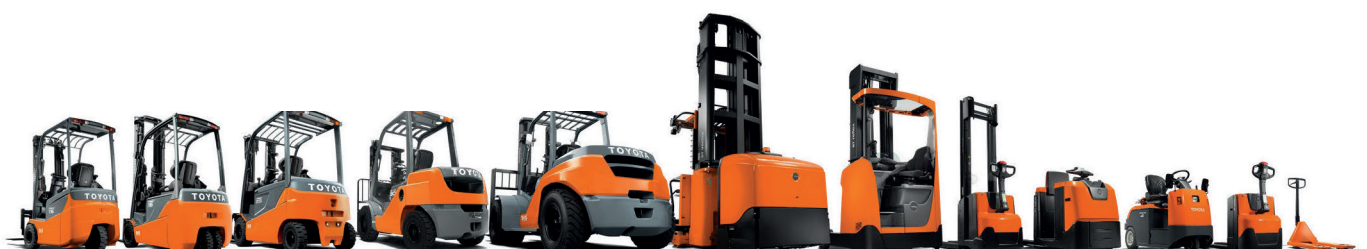
La gamma Toyota di carrelli controbilanciati da magazzino e trattori industriali.