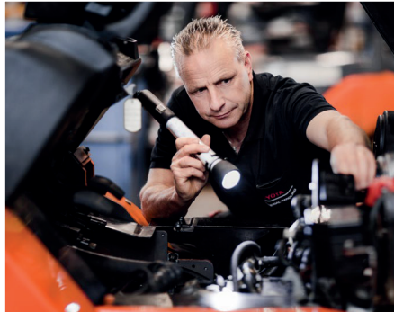
Toyota Service Concept