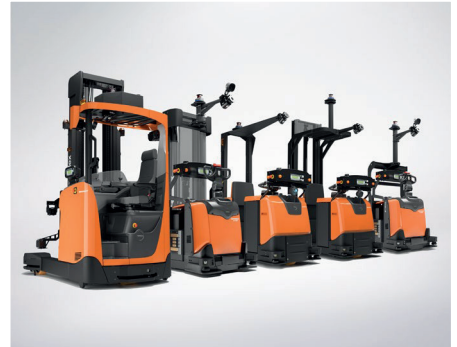
Gamma Toyota di carrelli da magazzino automatici